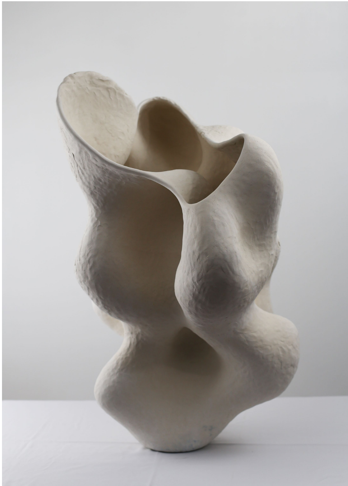
Sans titre, 2022