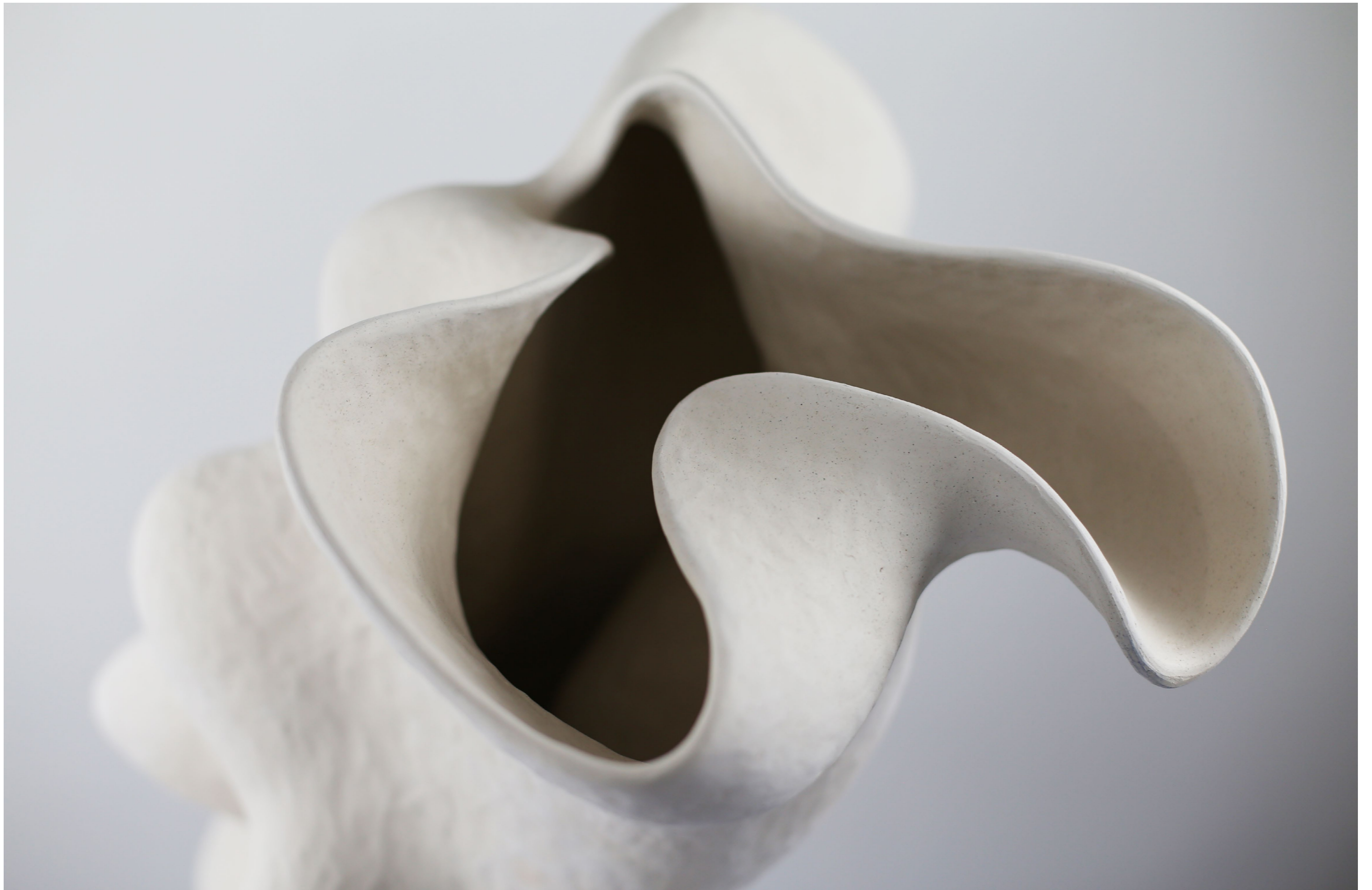
Sans titre, 2022 Céramique, Unique