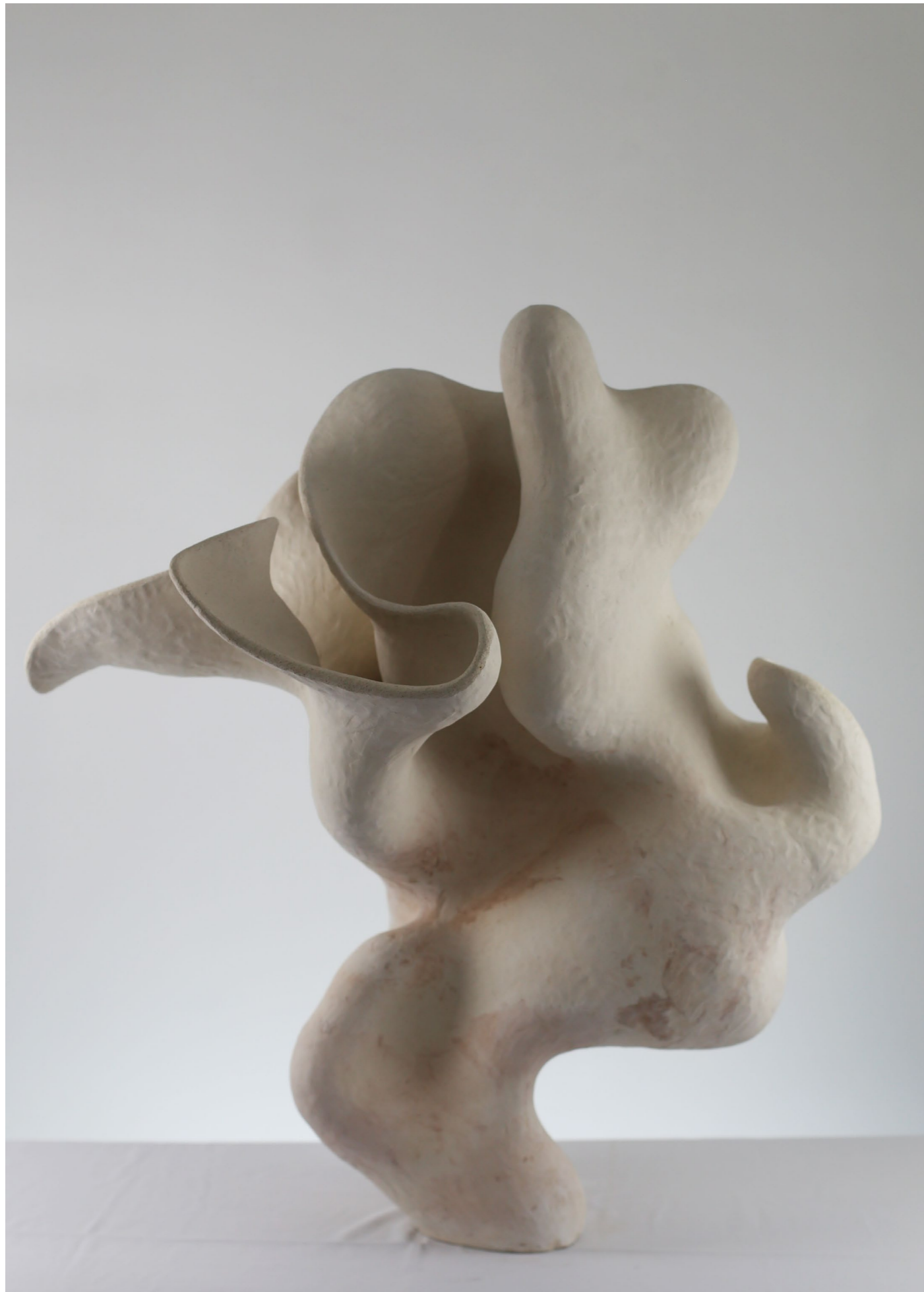
Shapes of incertitude series, 2021 C ramique, Unique