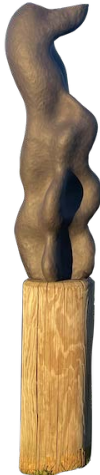
Sans Titre 2022 œuvre unique Sculpture grès noir, 80 x 22 cm présentée en extérieur

L'incertitude est primordiale dans le travail d'Olga Sabko. Son œuvre ne prétend pas à l'exactitude et elle décharge ses sculptures de toute responsabilité. Suggérant une impression de mouvement perpétuel, les formes qui sont données à voir ne sont pas définitives. Elles sont l'expression d'un mouvement constant à travers plusieurs dimensions visuelles et sensibles,