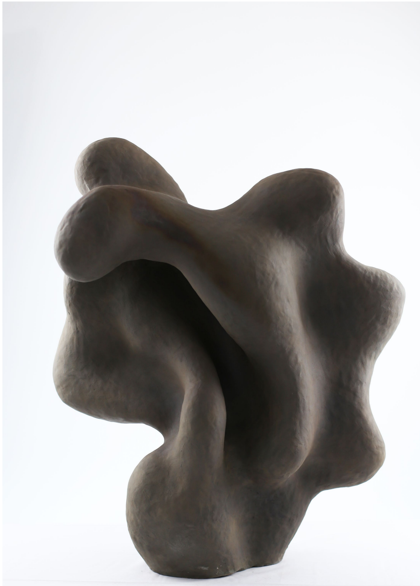
Sans titre, 2021 Céramique, engobe, cire Unique