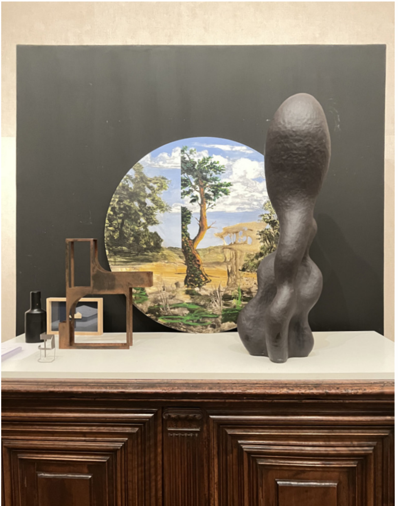
Tondo, Peinture sur bois de Nicolas PINCEMIN, Ø 80cm, l'arbre coupé, 2021 Sculpture métal, Helen VERGOUWEN œuvre 523 tirage 4, 38x32x4,5 cm, acier corten, 2017 Sculpture grès noir, Olga SABKO, sans titre, 80 x 22cm. 2022